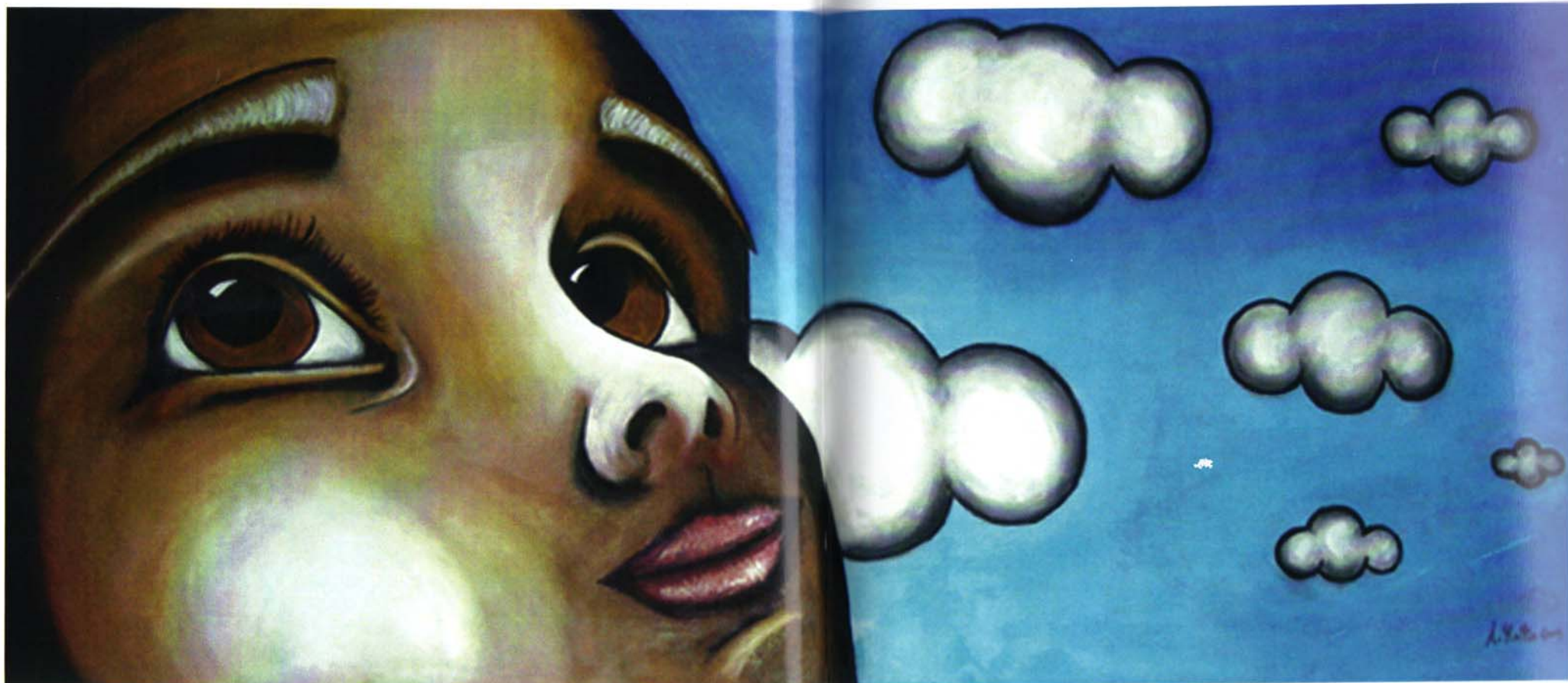
Alessandro Matta "Lasciami sognare in pace" Olio su tavola, cm 160x40, 2009