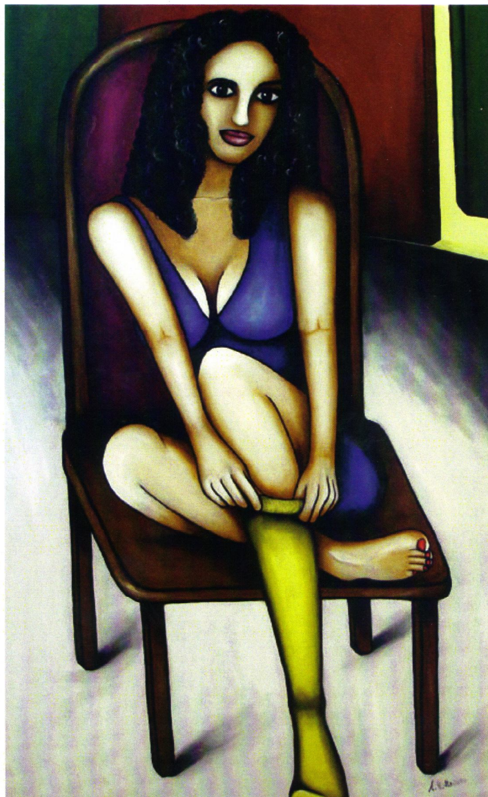
Alessandro Matta "Il calzino di Rossella" Olio su tavola, cm 60x100, 2010