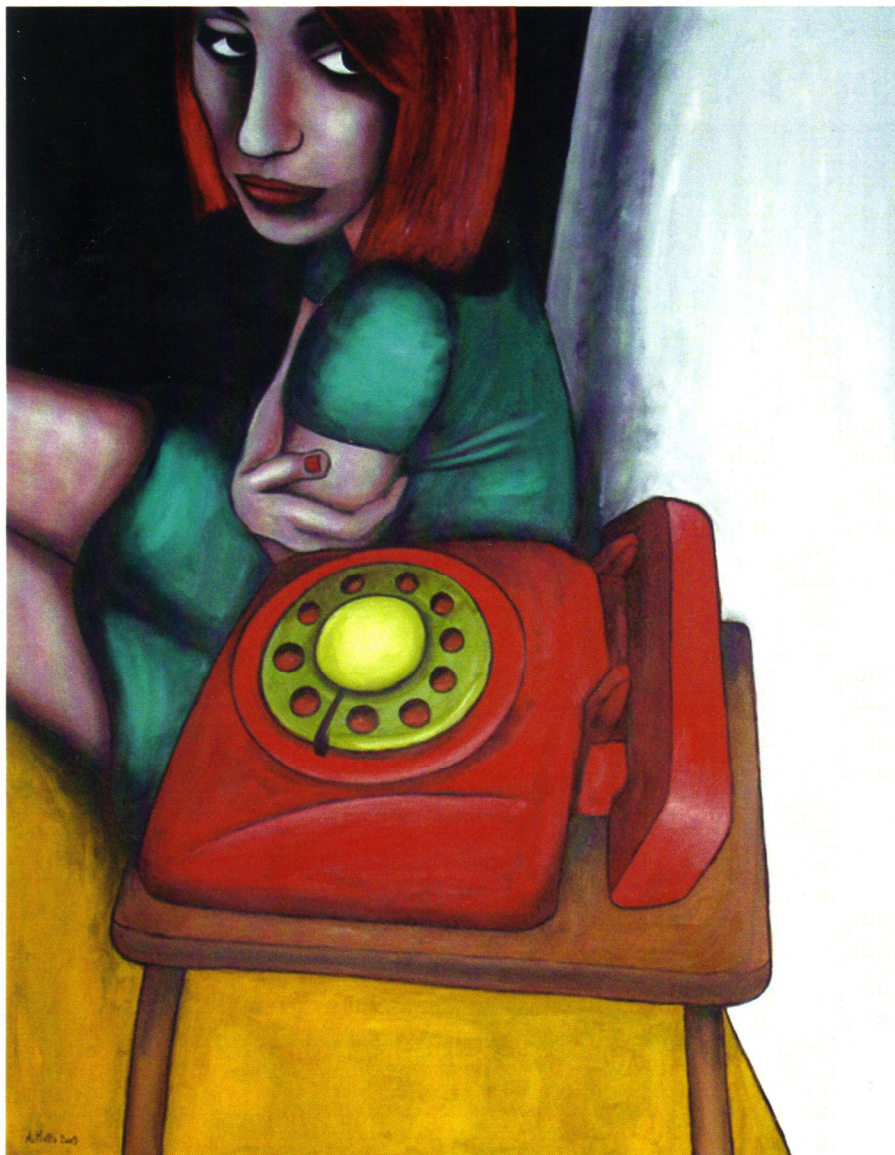
Alessandro Matta “Lo sai che non chiama” Olio su tavola, cm 70x90, 2009